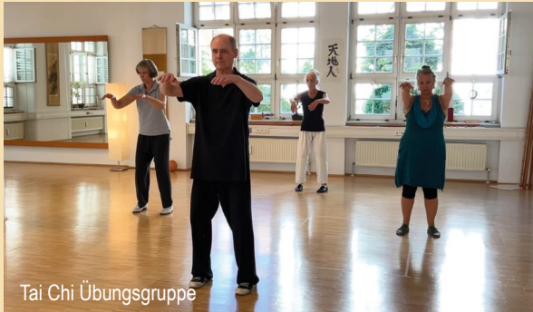
Tai Chi Übungsgruppe